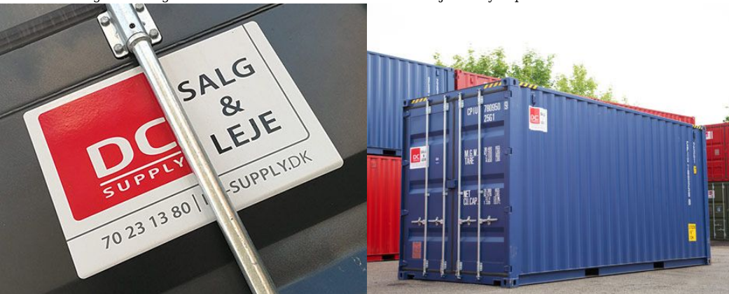
20 fods high cupe standard stålcontainer

20 og 40 fod high cube containere har ca. 30 cm ekstra højde at byde på.