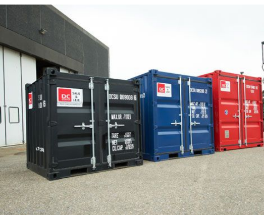
8 fods standard stålcontainer